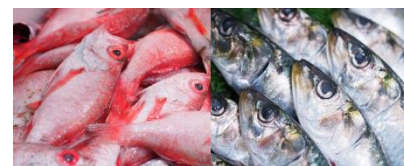
※『いなせり市場』取扱商品イメージ

豊洲市場の“仲卸による目利き力”を活かした高品質な魚介商品をご家庭でも味わっていただくことを目的に、2018年11月に開設したECマーケット。2019年12月からは青果の取り扱いも始めました。