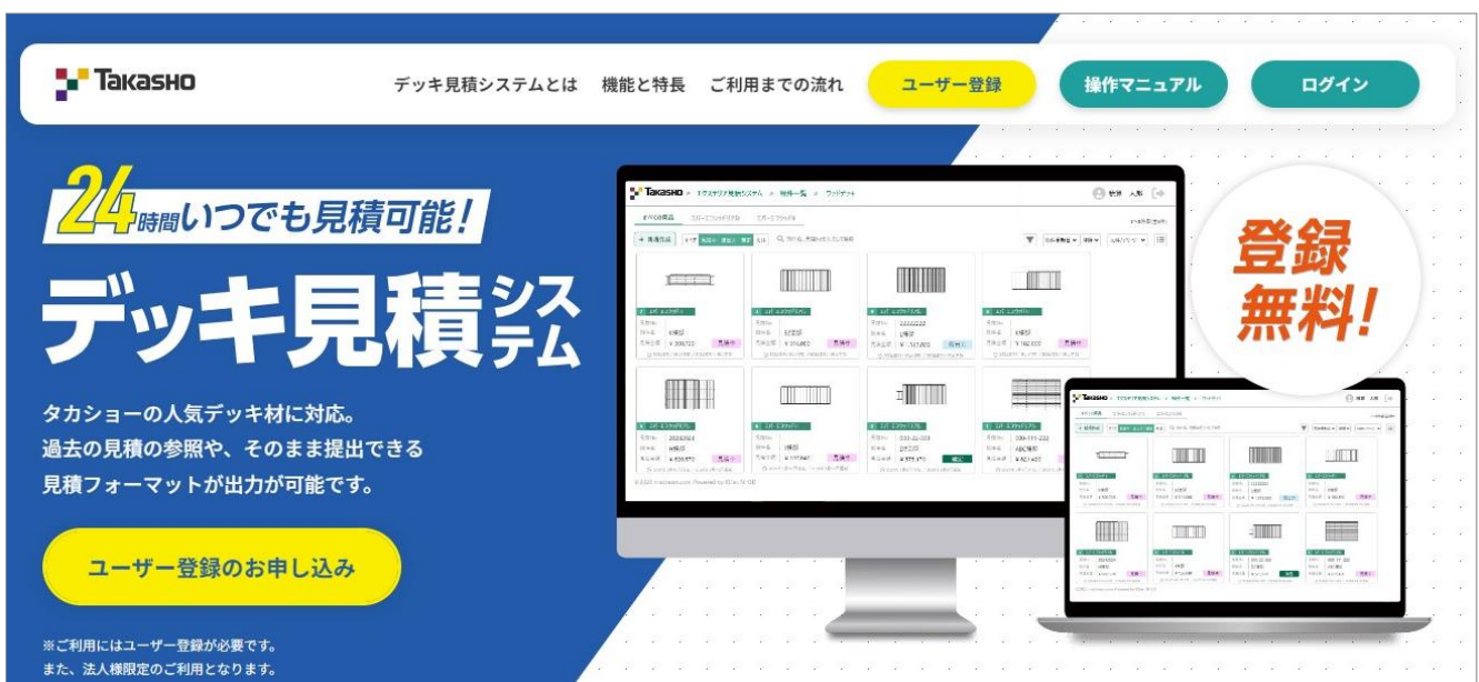
【デッキ見積システム イメージ】

ガーデンライフスタイルメーカーである株式会社タカショー（本社：和歌山県海南市 代表取締役社長：高岡伸夫 東証スタンダード：7590）は、24時間365日、人工木デッキの自動見積がブラウザ上で行える「デッキ見積システム」を2024年4月11日（木）にリリースしました。