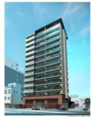
ワコーレ姫路 城巽ガーデンズ 【兵庫県姫路市】(2022年1月引渡予定) 総戸数:48戸 JR「姫路」駅徒歩11分

「ワコーレ垂水高丸一丁目」は、神戸市の郊外でも人気の高い垂水駅から駅近でありながら、住環境にも恵まれた物件であり、短期間で完売を迎えた。「ワコーレ芦屋大原」は、坪単価約500万円、戸当たり平均でも約1億2千万円と阪神間の高級立地の中でも、高額の物件となっている。「ワコーレ姫路 城巽ガーデンズ」は、地域拡大戦略の一環として兵庫県姫路市で開発した物件であるが、業容拡大の一環として地域拡大が定着してきたと言える。