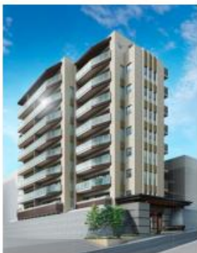
ワコーレ垂水高丸一丁目 【神戸市垂水区】(2021年3月引渡済) 総戸数:36戸 JR「垂水」駅徒歩7分