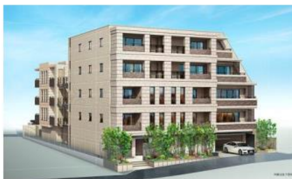
ワコーレ芦屋大原 【兵庫県芦屋市】(2022年2月引渡予定) 総戸数:13戸 JR「芦屋」駅徒歩5分