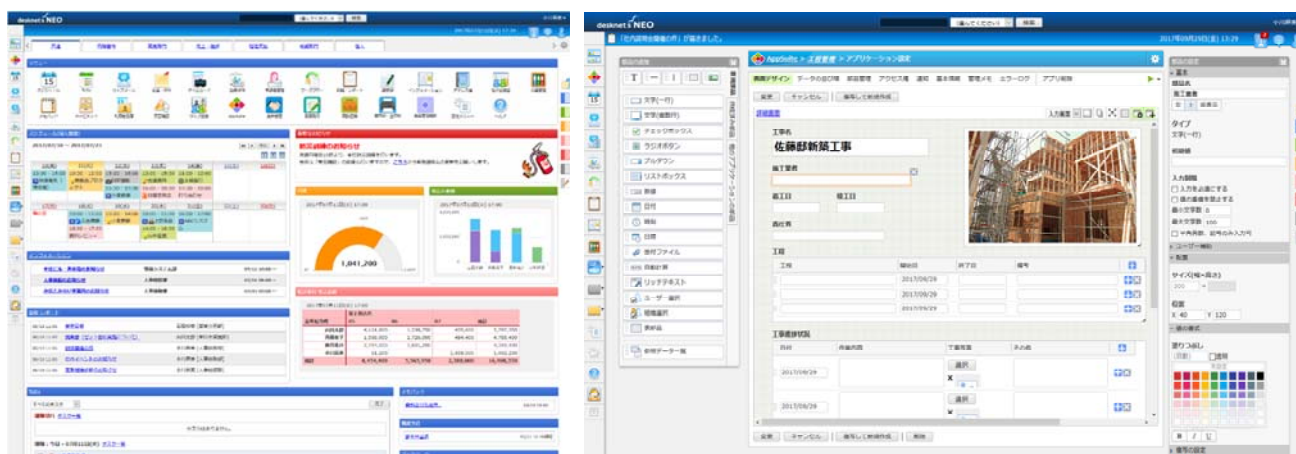
「desknet's NEO」ポータル画面（左）と「AppSuite」アプリ作成画面（右）

※「desknet's NEO」製品サイト URL： https://www.desknet.com/