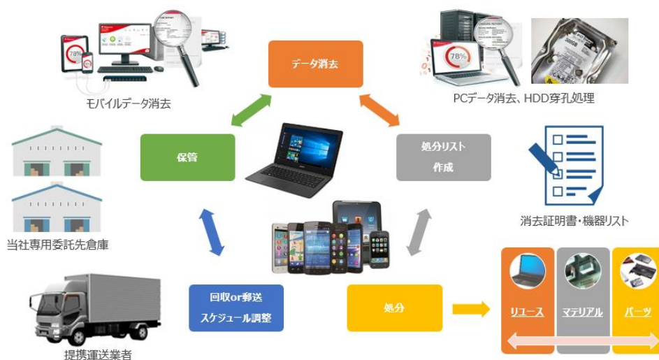
回収～消去～処分までの運用例

当社は今後さらに中古端末の買取サービスを拡大させるとともに、派生するビジネス展開を視野に入れ、サービスの幅を広げて参ります。