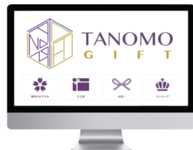
PC 注文画面 イメージ