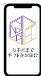
スマートフォン注文画面 イメージ

このサービスは、普段手土産を店舗で購入している企業の利便性向上に繋がるだけでなく、手土産を販売する店舗にとっても、新たな販路による売上向上を図れるほか、購買データの蓄積による新たな商品開発やサービスの改善にも繋げることが出来ます。