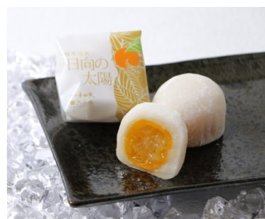
商品イメージ写真