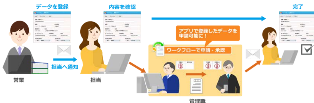
『desknet's NEO』のワークフローと『AppSuite』の連携イメージ

『AppSuite』に登録された各データの詳細画面からワークフローの申請を行えるようになりました。データ詳細のメニューに表示された「ワークフロー」ボタンをクリックすると『desknet's NEO』のワークフロー申請作成画面が開き、アプリごとにあらかじめ設定した申請書が表示されます。アプリに登録されたデータは HTML 化され、申請に添付されます。