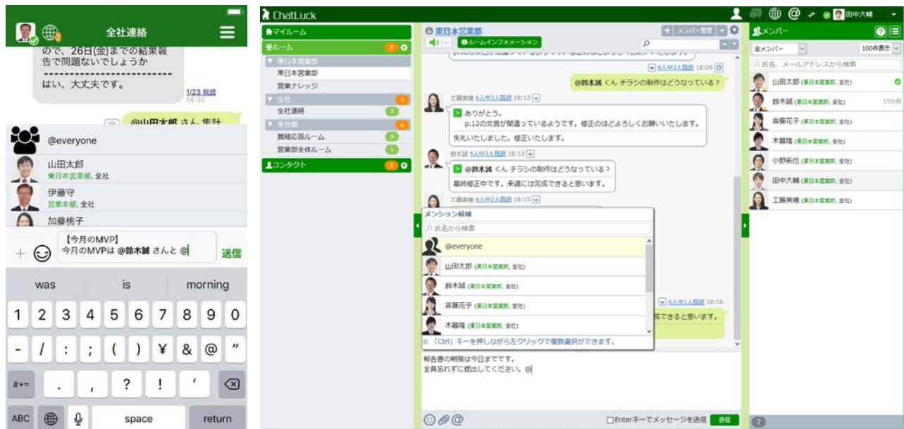
メンション活用中のスマートフォン（左）およびPC（右）画面

メンションした相手には専用のプッシュ通知が届くとともに、メンション専用の通知機能やメンション検索を使って対象のメッセージをすぐ見つけることができます。会話の流れが早いルームや、未読メッセージが溜まったルームでも、自分宛のメッセージを見落とすことがなくなります。