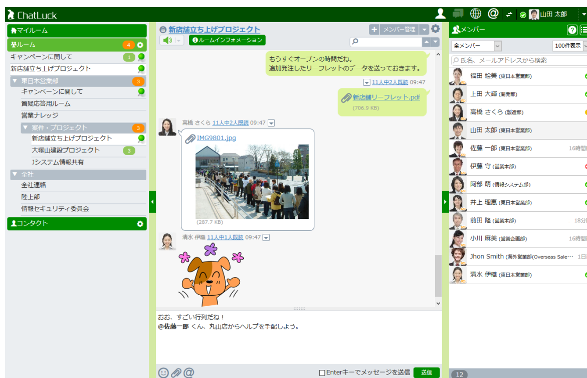
バージョン 3.6 利用画面