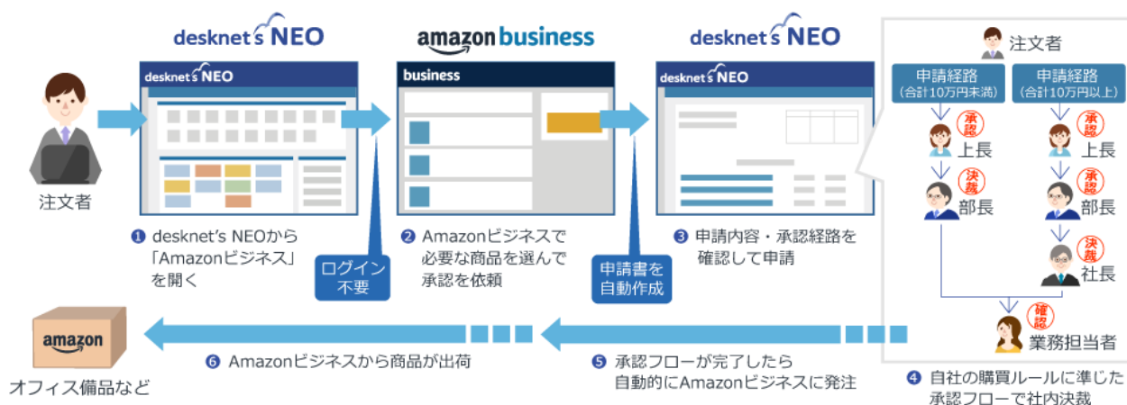
『desknet's NEO』のAmazon ビジネスとの連携動作フロー

( https://www.amazon.co.jp/business )」とシステム連携し、購買プロセス効率化およびコスト削減に役立つビジネス購買管理機能を搭載したグループウェア『desknet's NEO（デスクネッツ ネオ）』バージョン5.3を2019年7月30日（火）より提供開始します。