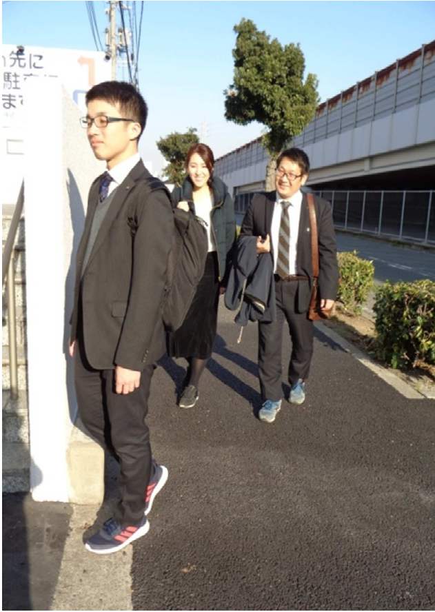
【スニーカー通勤風景】