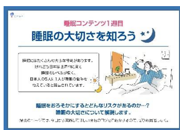
睡眠学習コンテンツ