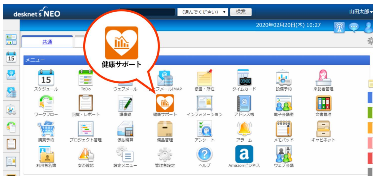
既存機能の連携で生まれた desknet's NEO V5.5「健康サポート」機能