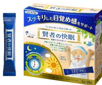
賢者の快眠 睡眠リズムサポート