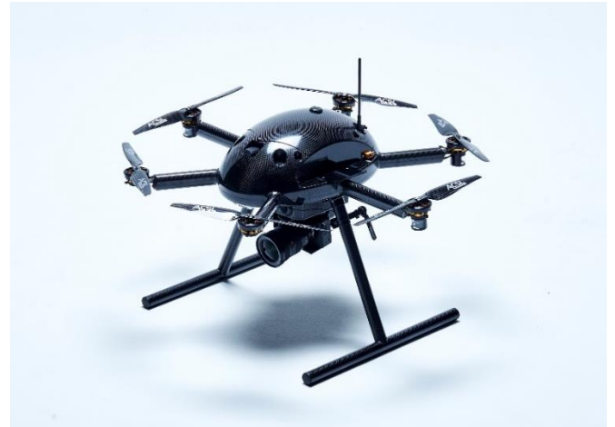
写真) 国産の産業用ドローン ACSL-PF2 風力発電点検仕様