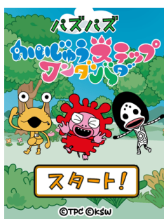
※タイトル画面イメージ

第1弾として1月25日（月）から開始するのは「パズパズかいじゅうステップ ワンダバダ」。「ピグちゃん」「カネちゃん」「ダダちゃん」のキャラクターが描かれたカードを3枚並べて消して得点を競う、親子でお楽しみいただけるパズルゲームとなっております。