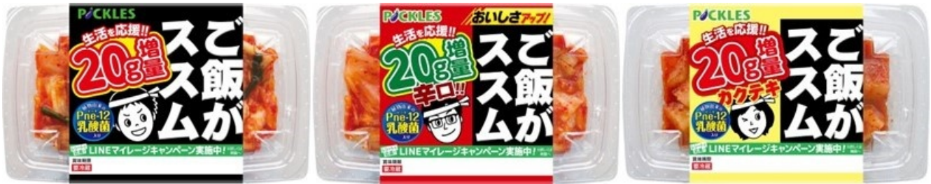
ご飯がススムキムチ