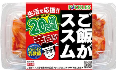
ご飯がススム辛口キムチ