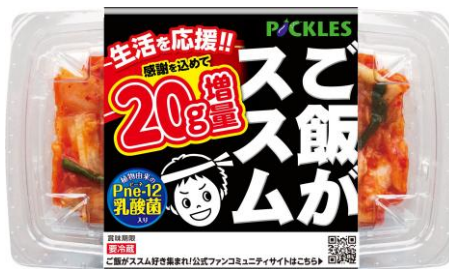
ご飯がススムキムチ