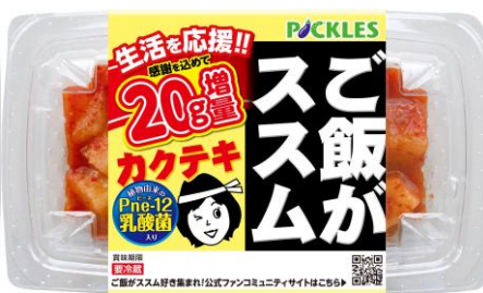
ご飯がススムカクテキ