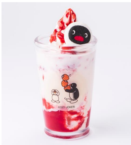
フルーツみるく～いちご～ 858円（税込）