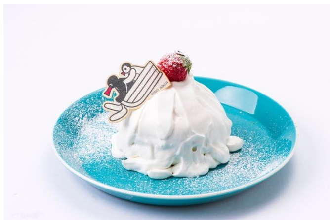
ピングーの雪山みるくいちごパンケーキ 1,320円（税込）

たっぷり果肉の入った特製みるくにピングーマシュマロをトッピング！ 3種類のお好きなフルーツをお楽しみください！