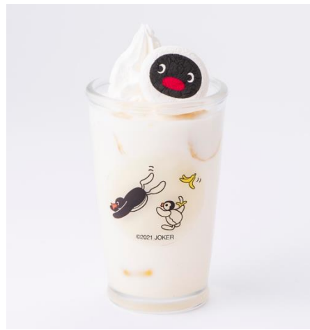
フルーツみるく～バナナ～ 858円（税込）

たっぷり果肉の入った特製みるくにピングーマシュマロをトッピング！ 3種類のお好きなフルーツをお楽しみください！