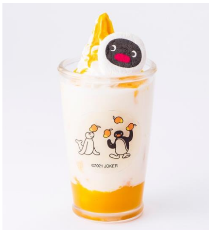
フルーツみるく～マンゴー～ 858円（税込）