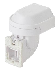
オプションブラケット