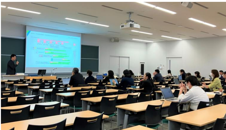
（11月）京都橘大学様 職員対象学内研修

引き続き、一般社団法人大阪府専修学校各種学校連合会、京都外国語大学等での実施を予定しています。