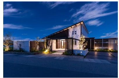
株式会社リバーフォレスト 様 (福井県) 『理想のお庭を実体験いただけます』