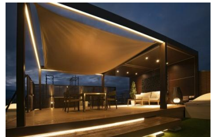
アイスタイルガーデン 様 (山形県) 『天空リゾート』