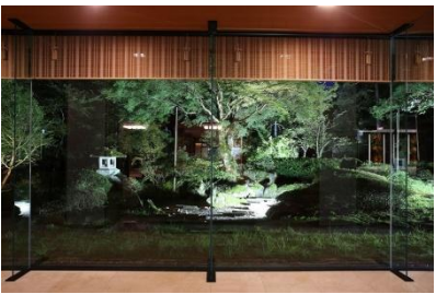
株式会社岸グリーンサービス 様 (石川県) 『おもてなしの灯りは静かに鮮やかに』