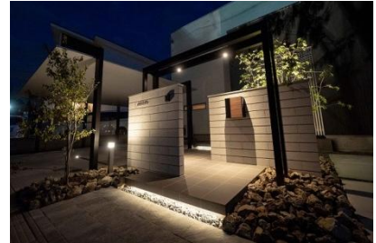
ExLEAF 様 (長野県) 『浮遊感のあるエントランス』