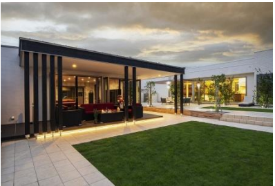
有限会社創園社 様 (群馬県) 『ゆったりくつろげるプライベートガーデン』