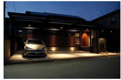
株式会社ハマホーム 様 (兵庫県) 『京の旅館をイメージした和モダンな ファサード』