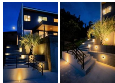
クレアカーサ 株式会社日立リアルエステートパートナーズ 様 (千葉県) 『Light the step ~空に向かって』