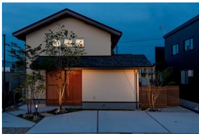
株式会社クラシコ 様 (岩手県) 『床に落ちた縦格子の影と、 外壁を広く照らす灯り』