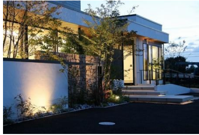
株式会社ボックスウッド 様 (千葉県) 『通いたくなる歯科クリニック』