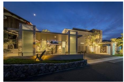
パーチェフル/GRAZIE MILLE 様 (滋賀県) 『リゾートを感じる光の演出』