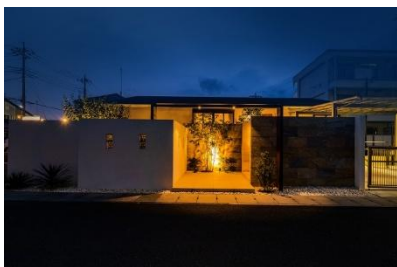
癒樹工房 埼玉支店 様 (埼玉県) 『家と外構をひとつの作品として捉えた シンプルで寛ぎに満ちた家』