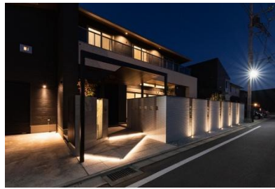
ガーデンプラス 神戸 様 (兵庫県) 『光と影をコントロールして美しさを生み出す 新築外構一式工事』