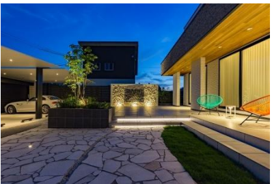
株式会社ベストエクステリア 様 (岐阜県) 『ライティングで彩るリゾートスタイルの邸宅』