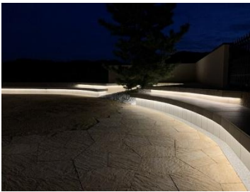
Garden studio 庭楽館 様 (兵庫県) 『ベンチに広がる幻想的な光』