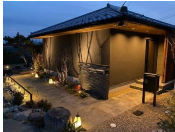
株式会社ASUKA 様 (群馬県) 『幻想的な植栽ライティング』