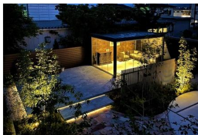
株式会社エコ、グリーン設計 様 (埼玉県) 『優雅なプライベート空間』