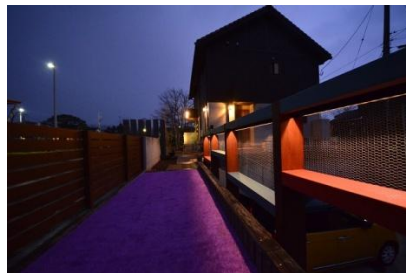
株式会社ジールランド 様 (宮城県) 『北欧の夜をイメージ』