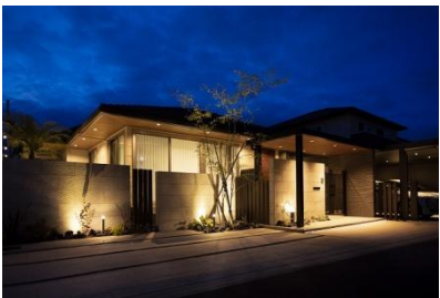
ソーケンサービス/マイ・パティオ 様 (静岡県) 『平屋の魅力を際立たせる灯りの流れ』