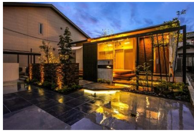
Garden B 様 (福井県) 『リビングの大きな窓からの景色と外観とのバランスを考慮したデザイン』