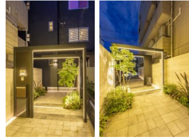
株式会社LAND-H.A.G 様 (神奈川県) 『ホテルのエントランスのようなアプローチ』