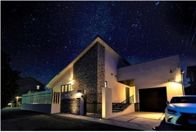
株式会社ワンストーン/エスティナ木更津 様 (千葉県) 『ラグジュアリーリゾートを自宅で実現』