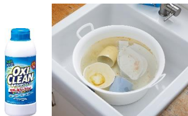
オキシクリーンを使用した 食器のオキシづけ

衣類用の漂白剤として広く使われている液体タイプの酸素系漂白剤は、洗濯洗剤だけでは落とすににくい汚れとニオイを落としてくれるお役立ちアイテムです。汚れは落としたいけど手間はかけられないという忙しい方には、簡単に使える液体タイプの「オキシクリーンパワーリキッド」はおすすめです。衣類の抗菌・ウイルス除去ができるのもポイントですね。一方、粉末タイプの「オキシクリーン」は、頑固な汚れやニオイのついた衣類の洗濯に加え、食器の茶渋を落としたり、窓ガラスの汚れにも使えたりと家中のお掃除でお使いいただけます。まずは洗濯には液体タイプの「オキシクリーンパワーリキッド」、お掃除には「オキシクリーン」と使い分けてみてください。