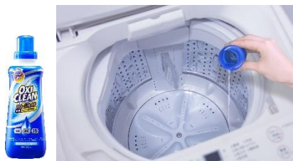
オキシクリーンパワーリキッドを使った オキシ足し